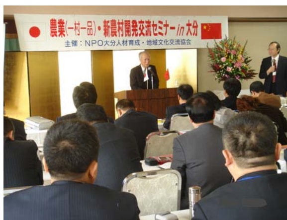
原总理村山富市在中国培训团开讲仪式上讲话